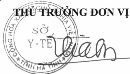
Trần Thái Sơn

Sở Y tế kính đề nghị Ủy ban nhân dân tỉnh công nhận đơn vị đạt tiêu chuẩn “An toàn về an ninh trật tự” năm 2017. Thái Sơn