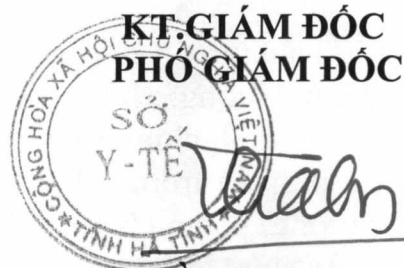
Trần Thái Sơn