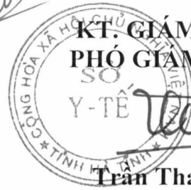
Trần Thái Sơn