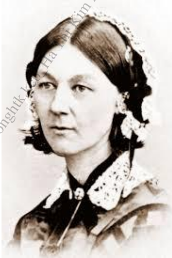
Florence Nightingale 12/5/1820 – 13/8/1910

Ngày Quốc tế Điều dưỡng hằng năm được các nước trên thế giới tổ chức vào ngày 12 tháng 5, ngày sinh của bà Florence Nightingale, nhằm tưởng nhớ những cống hiến to lớn của bà đối với việc hình thành và phát triển của ngành điều dưỡng hiện đại cũng như sự ghi nhận, tôn vinh của xã hội về vai trò của của người điều dưỡng trong chăm sóc con người đặc biệt là chăm sóc người bệnh.